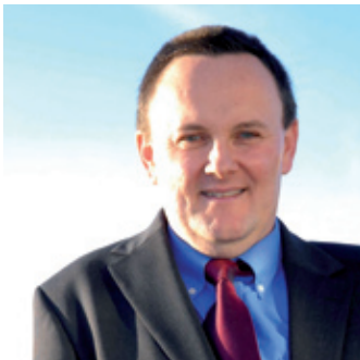
Keith Towler, Comisiynydd Plant Cymru