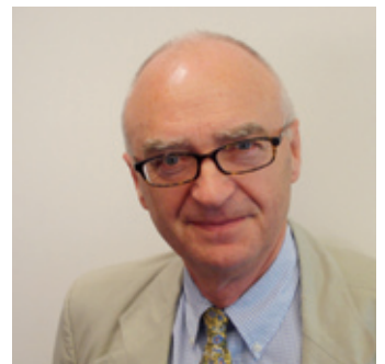
Syr Al Aynsley-Green, Comisiynydd Plant Lloegr